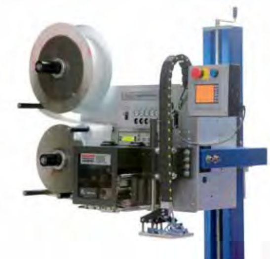
Technische Änderungen jederzeit vorbehalten!

Bedienerfreundlich sind zahlreiche Funktionen wie Wartungsintervall- oder Betriebszustandsanzeige. Sie melden u. a. per Signal oder per E-Mail an eine festgelegte E-Mail-Adresse das Erreichen eines Servicetermins oder Störungen, zum Beispiel durch das Ende des Verbrauchsmaterials. Das mehrsprachige Display mit Klartext lässt sich frei positionieren und somit für den Bediener auch bei engen Produktionsverhältnissen immer gut erreichen. Der eingebaute Webbrowser bietet die Möglichkeit zur Einsicht des aktuellen Wartungsstandes auch per Ferndiagnose.